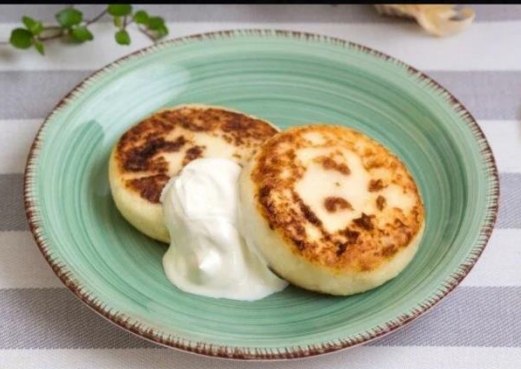
Сырники сметана/джем сгущенное молоко/ мед 140г.-100