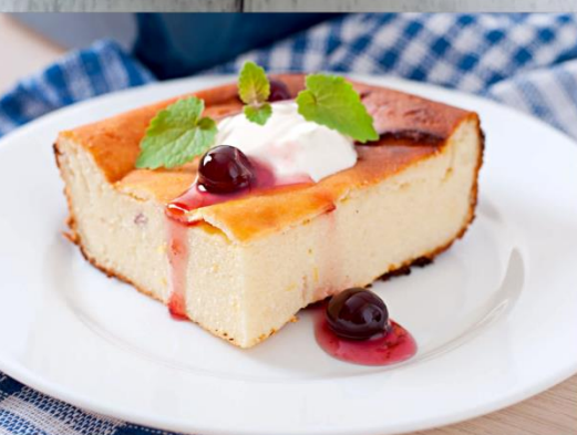
Запеканка сметана/джем сгущенное молоко/ мед 120г.-60