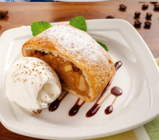
Штрудель яблоко/банан творог 120г.-60