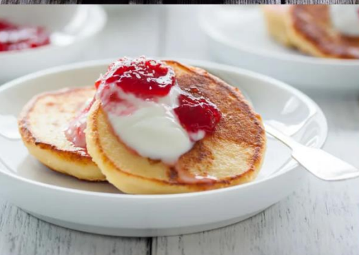
Оладушки сметана/джем сгущенное молоко/ мед 120г.-60