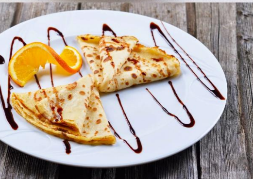
Блинчики сметана/джем сгущенное молоко/ мед 120г.-60